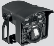
CONDOR RADAR met stilstand detectie