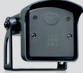
FALCON RADAR met instelbare bewegingssensor