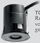
TOF/SPOT RADAR voor binnen- gebruik