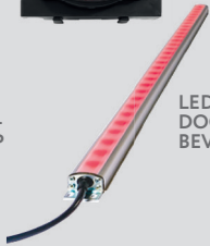
LED DOORGANGS- BEVEILIGING