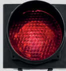
ROOD VERKEERS- LICHT