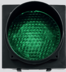
GROEN VERKEERS- LICHT